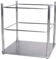
■ パイプタイプ SPH-G1000P