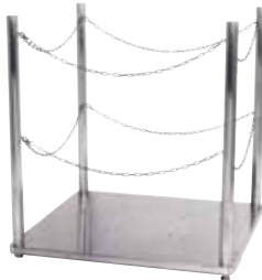
■ チェーンタイプ SPH-G1000C