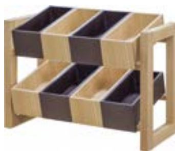
アメニティバイキングBOXセット 59-09 R-71-07 W580×D275×H435 ¥137,500