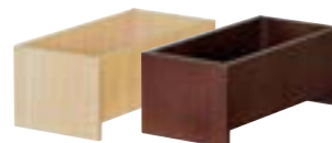
アメニティバイキングBOX箱 ナチュラル・ダーク 59-11 R-71-09 W260×D120×H100 ¥12,500