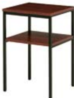
多目的スタンド ローズ 59-05 R-71-10 W450×D450×H700 天板メラミン・スチール(ブラック) ¥58,000