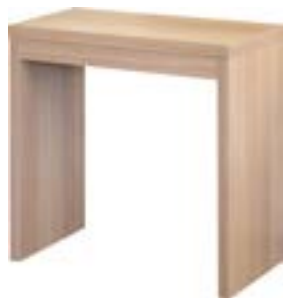
荷物置台 天板メラミン ナチュラル 59-02 R-45-44 W550×D300×H550 木製・天板メラミン ¥82,000