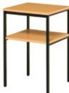
多目的スタンド ナチュラル 59-06 R-71-11 W450×D450×H700 天板メラミン・スチール(ブラック) ¥58,000