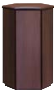
彦六 59-04 R-71-02 W335×D300×H575 天板ビニールレザー張り・ポリ合板 ¥190,000