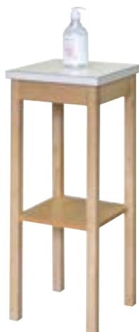
消毒液スタンド ナチュラル色 59-08 R-71-06 W300×D300×H750 天板メラミン 木製ウレタン塗装 ¥32,000