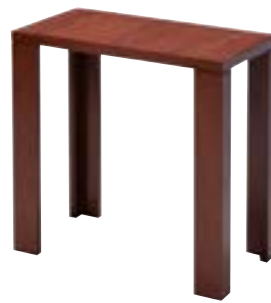
荷物置台 59-03 R-45-43 W550×D300×H550 木製・メラミン・ウレタン塗装 ¥62,000