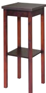
消毒液スタンド ブラウン色 59-07 R-71-05 W300×D300×H750 天板メラミン 木製ウレタン塗装 ¥32,000