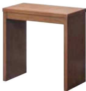
荷物置台 天板メラミン ブラウン 59-01 R-45-42 W550×D300×H550 木製・天板メラミン ¥82,000