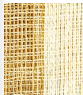
NLM4556 90cm×120cm NLM4561 90cm×150cm 麻のれん 柄⑤ NK(生成)