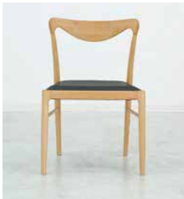
Chair : SLC-504 NA