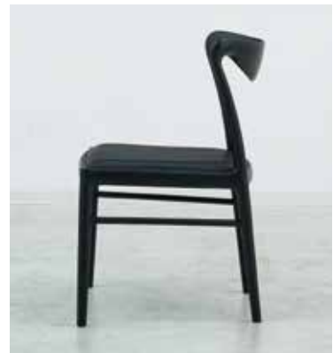
Chair : SLC-504 BK