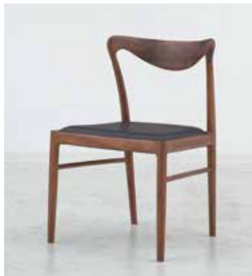
Chair : SLC-504 WAL