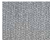
CODA178 ポリエステル95% アクリル5%