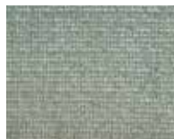
NIGHT353 リサイクルポリエステル51% アクリル49%