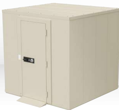
SR-400 受 ¥6,930,000 (税別)