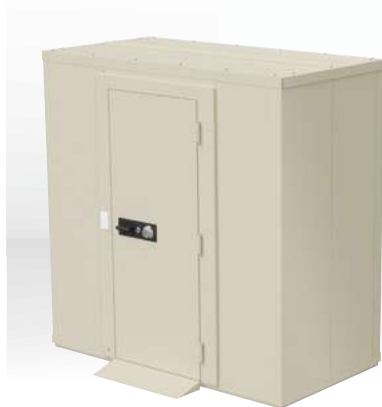
SR-200 受 ¥4,851,000 (税別)