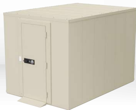
SR-600 受 ¥9,845,000 (税別)