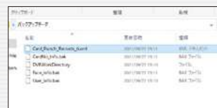
ファイル一覧イメージ