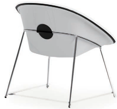
ラウンジチェア (LY055 J)