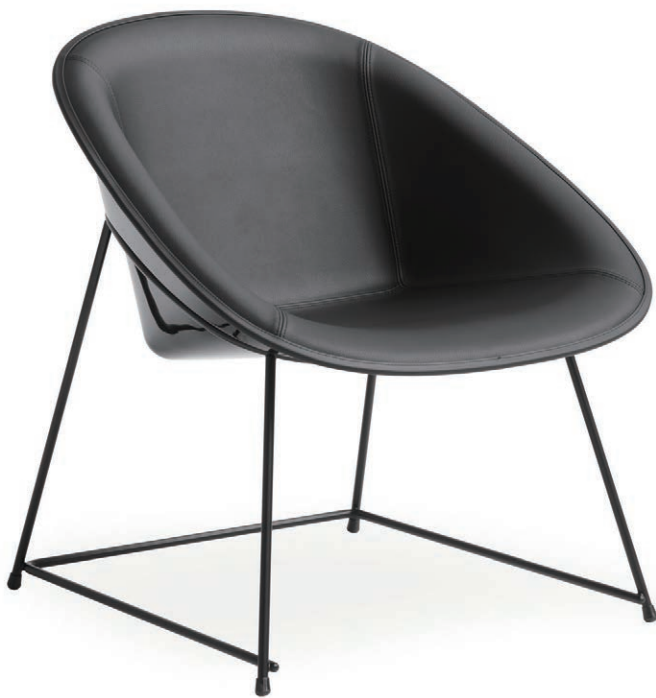
ラウンジチェア (LY054 J)

特徴的なジオメトリーを構成するプラスチックシェルと細いスチールパイプ。シェルをリングで支える構造は意匠性と強度を兼ね備え、プラスチックの光沢が張地の質感と対比しながらエレガントな緊張感を表現しています。ミーティングスペースやダイニングで使いやすいチェアタイプとラウンジチェアタイプがあり、ラウンジはテーブルも選べます。