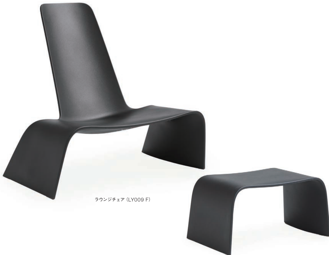
ラウンジチェア (LY009 F)

回転成型技術により形成された有機的なシェイプを描くラウンジチェア。幅の広いゆったりとしたシートは、適度な傾斜により身体を預けることができリラックスした姿勢を保ちます。リゾートのテラスでは足を伸ばして寛げるオットマンとの組み合わせも快適で、屋内のラウンジや待合ではユーモラスな存在感が心地よくシーンに馴染みます。