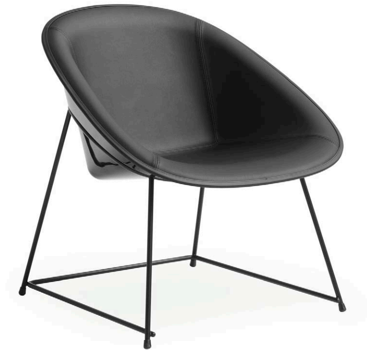
ラウンジチェア (LY054 J)

特徴的なジオメトリーを構成するプラスチックシェルと細いスチールパイプ。シェルをリングで支える構造は意匠性と強度を兼ね備え、プラスチックの光沢が張地の質感と対峙しながらエレガントな緊張感を表現しています。ミーティングスペースやダイニングで使いやすいチェアタイプとラウンジチェアタイプがあり、ラウンジはテーブルも選べます。