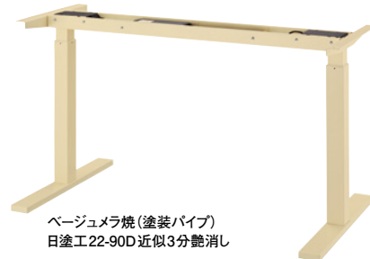
ベージュメラ焼(塗装パイプ) 日塗工22-90D 近似3分艶消し