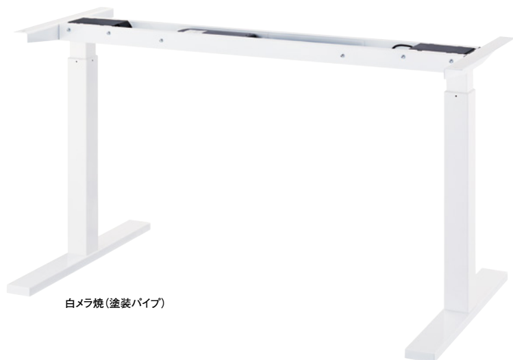
白メラ焼(塗装パイプ)

※この製品を販売していただくには、経済産業省へ届出書の提出や、自主検査等が必要となります。簡単な手続きですので、詳細は各担当者までお問い合わせください。