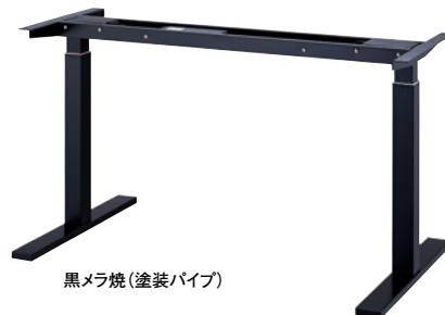
黒メラ焼(塗装パイプ)