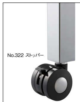
No.322 ストッパー キャスター付(TYE限定) 1本価格から ¥1,000アップ