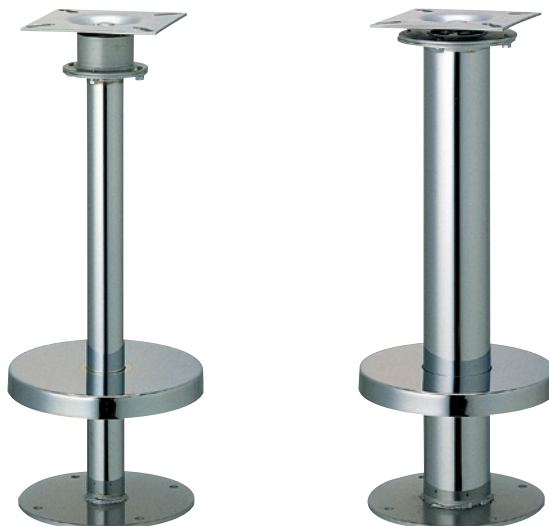
リターン42・50・60 (No.607カバー)