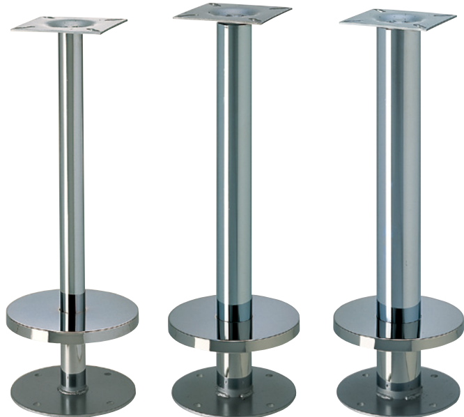
スティック42 (No.607カバー)