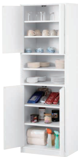
SDP-1800 (WH) (使用例)