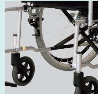
フットサポートが取り外せるため、足こぎが可能です。