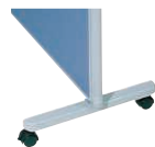
安定脚(キャスター付) MP-FK