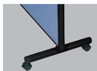
安定脚(キャスター付) MPB-FK