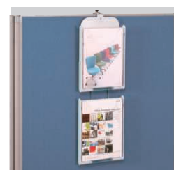
PCP-102(WH) (パンフレットケース)