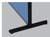
安定脚(アジャスター付) MPB-F