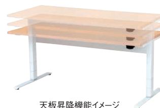
天板昇降機能イメージ

仕様/天板:抗ウイルスメラミン化粧板 フラッシュ加工 抗ウイルスABSエッジ 天板裏:抗ウイルスバックer フレーム:スチール 粉体塗装(ホワイト) 入数:1(2個口) ●ガスシリンダー式天板昇降機能付