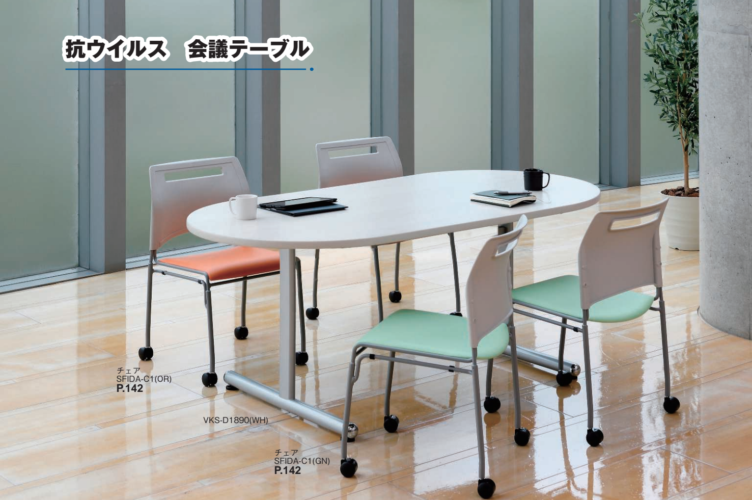
チェア SFIDA-C1(OR) P.142