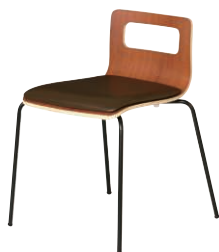
ALES-TP-BR-BR-B ブラウン・ブラウン