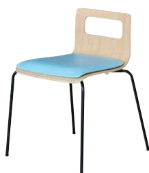
ALES-TP-NA-GAQ-B ナチュラル・アクア