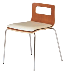
ALES-TP-BR-IV ブラウン・アイボリー