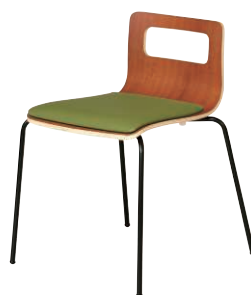
ALES-TP-BR-CGN-B ブラウン・グリーン