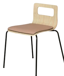
ALES-TP-NA-CBJ-B ナチュラル・ベージュ