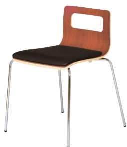
ALES-TP-BR-CBK ブラウン・ブラック