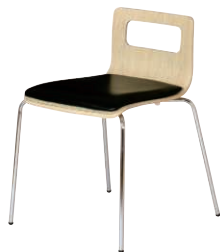
ALES-TP-NA-BK ナチュラル・ブラック