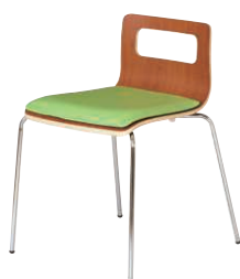
ALES-TP-BR-GLM ブラウン・ライム