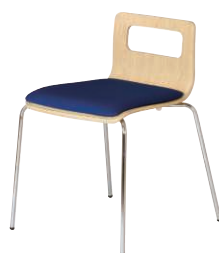
ALES-TP-NA-FBL ナチュラル・ブルー