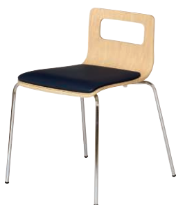
ALES-TP-NA-CNV ナチュラル・ネイビー