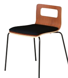
ALES-TP-BR-FBK-B ブラウン・ブラック