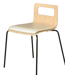
ALES-TP-NA-IV-B ナチュラル・アイボリー