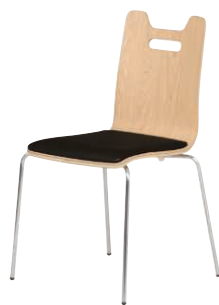
ALES-HP-NA-CBK ナチュラル・ブラック