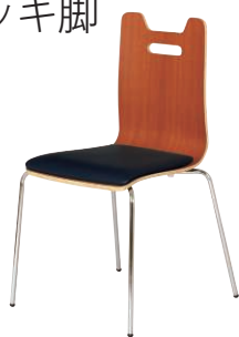
ALES-HP-BR-CNV ブラウン・ネイビー