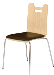
ALES-HP-NA-BR ナチュラル・ブラウン