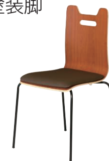
ALES-HP-BR-FBK-B ブラック・ブラック