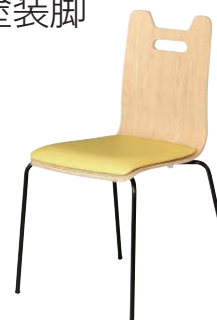
ALES-HP-NA-GYE-B ナチュラル・イエロー