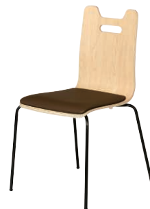
ALES-HP-NA-CBR-B ナチュラル・ブラウン