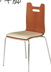
ALES-HP-BR-IV ブラウン・アイボリー