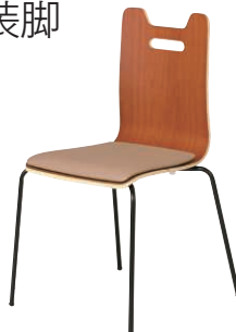
ALES-HP-BR-CBJ-B ブラウン・ベージュ