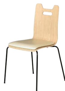
ALES-HP-NA-IV-B ナチュラル・アイボリー