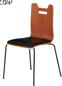
ALES-HP-BR-BK-B ブラウン・ブラック