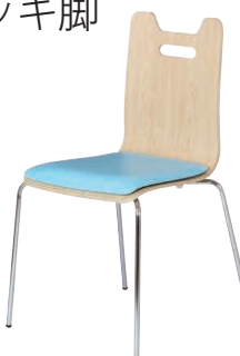
ALES-HP-NA-GAQ ナチュラル・アクア