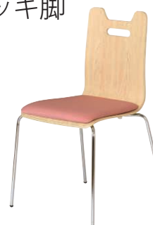
ALES-HP-NA-FPK ナチュラル・ピンク