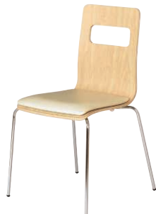
ALES-P-NA-IV ナチュラル・アイボリー