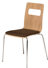
ALES-P-AK-CBR オーク・ブラウン