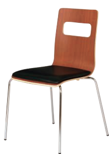
ALES-P-BR-BK ブラウン・ブラック