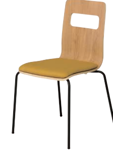
ALES-P-AK-FMS-B オーク・マスタード