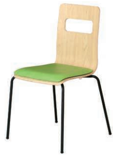
ALES-P-NA-GLM-B ナチュラル・ライム