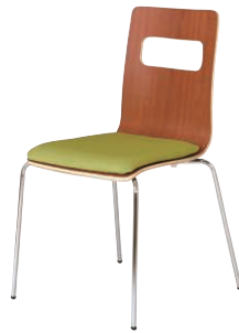
ALES-P-BR-FGN ブラウン・グリーン