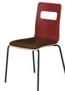
ALES-P-BR-B ブラウン・ブラウン