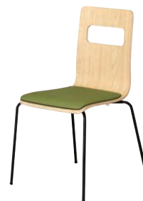
ALES-P-NA-CGN-B ナチュラル・グリーン