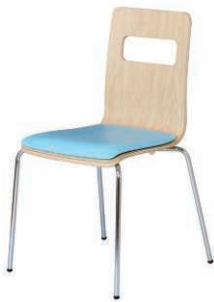
ALES-P-NA-GAQ ナチュラル・アクア