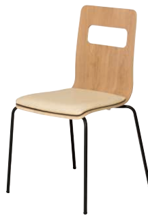
ALES-P-AK-IV-B オーク・アイボリー