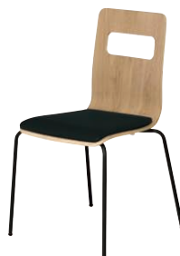
ALES-P-AK-CBK-B オーク・ブラック