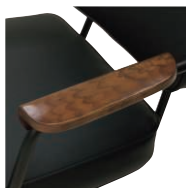
木製アームレスト