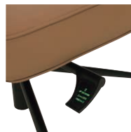
昇降・ロックングレバー