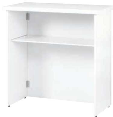
UC-900 (WH) 中棚付