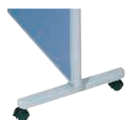
安定脚(キャスター付) MP-FK