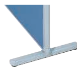
安定脚(アジャスター付) MP-F