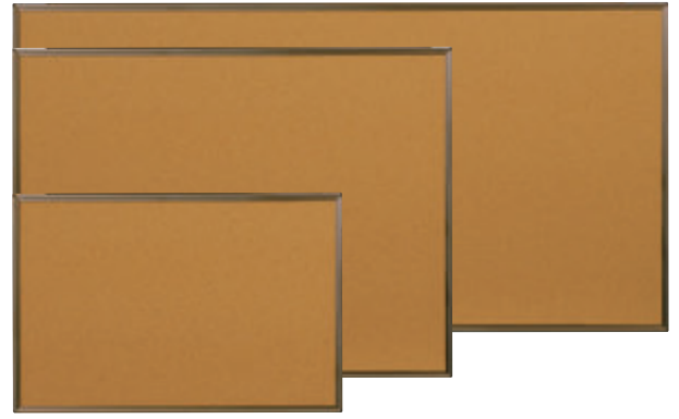
ワンウェイ掲示板カラーアルミ枠 (天然コルク)