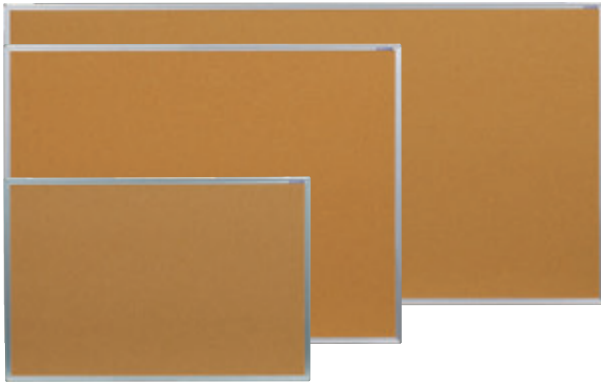
ワンウェイ掲示板 (天然コルク)