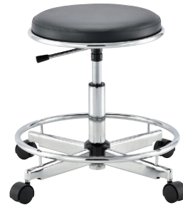
SK-87 (足掛けリング付き)