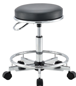
SM-17 (足掛けリング付き)