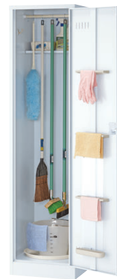
③ SWAW-455 NEW