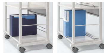
A4横型ファイル収納 A4縦型ファイル収納

A4横型ファイルを収納する場合は、後部フレームのファイルストッパーを上げ、縦型ファイルの場合は、下げてください。ファイルが棚板手前に揃い、取り出し易く、整然と収納できます。