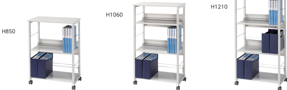
① NA-002WG ●A4縦型ファイル棚×各2段