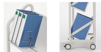
ファイルサポート付

W882×D360×H1290 ●ファイルサポート6本付 有効内寸/W811×D225×下段・中段H360