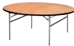
樹脂取手付タイプ(別途見積り)