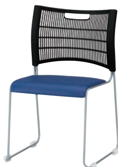
NSC-40L-S: インディゴブルー