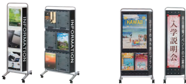
パンフレットケース取付例