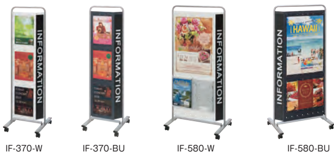
IF-370-W IF-370-BU IF-580-W IF-580-BU

『INFORMATION』の文字が見え、正面からも側面からでもアピールできるインフォメーションスタンド。