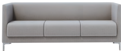
HDLC-A23 : F-A52-01