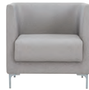
HDLC-A21 : F-A52-01