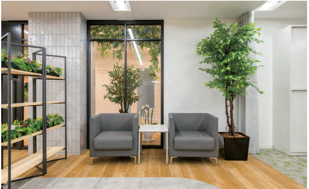
HDLC-A23 (アルミダイキャスト脚)