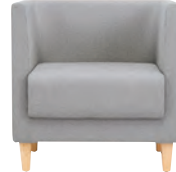
HDLC-W21 : F-A52-01