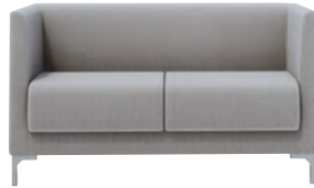
HDLC-A22 : F-A52-01