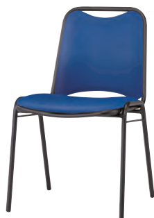
FSR-B4L-S: インディゴブルー