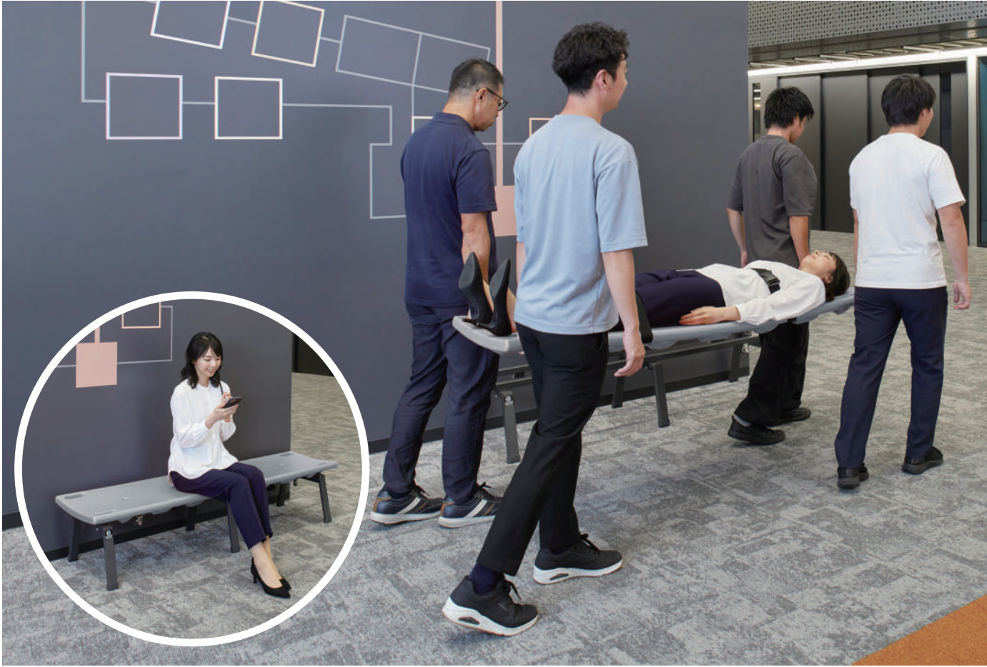
レスキューボードベンチ（グレー）