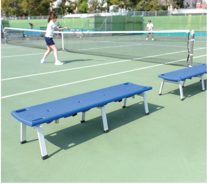
レスキューボードベンチ（ブルー）