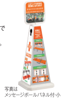
写真はメッセージボールパネル付・小

※メッセージボールパネル付をご希望の際は、レスキューボードベンチかレスキューベンチのいずれを使用しているかお知らせください。