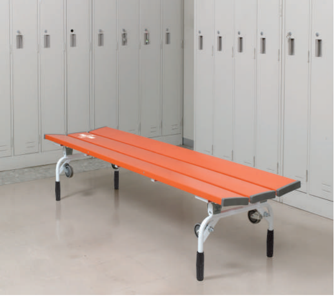
レスキューベンチ（レスキューオレンジ）

座面裏側に固定ベルトがセットされているので、搬送時に要救護者をしっかり固定できます。