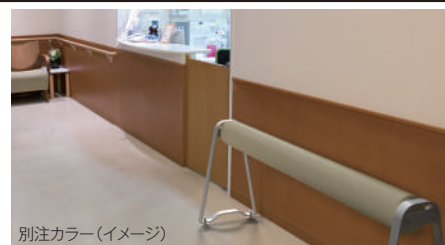
別注カラー(イメージ)