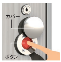
盗難・いたずら防止用のボタンカバー付