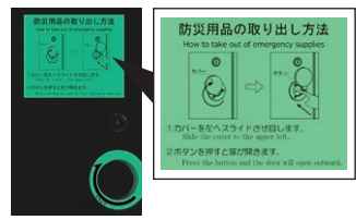
暗闇で光る蓄光サインで取り出し方法を表示します。