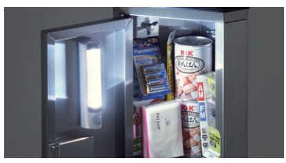
開けると点灯するセンサーライト付ハンドライトとしても使用可能です。