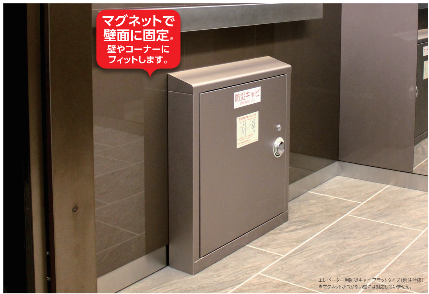
エレベーター用防災キャビネット フラットタイプ (別注仕様) ※マグネットがつかない壁には対応していません。