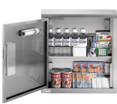
※セット内容は変更する場合があります。