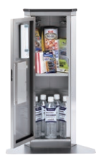
※セット内容は変更する場合があります。