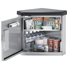
※セット内容は変更する場合があります。