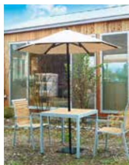
6角 2000 サイズ