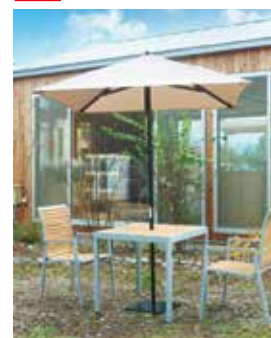
スクエア 1800 サイズ