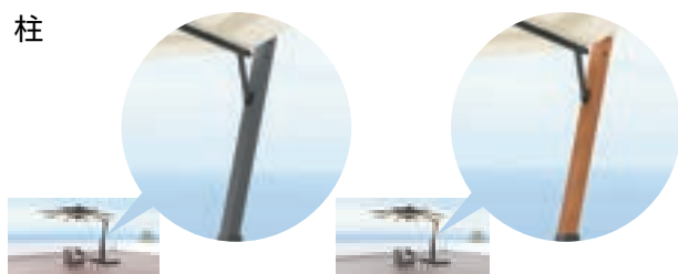
【標準】艶消しブラック