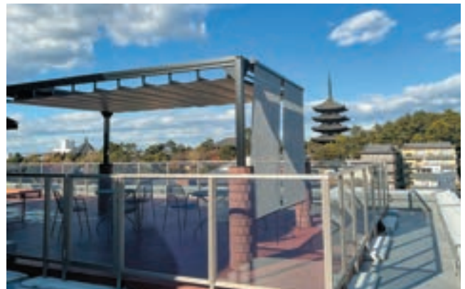
スクリーン取付例

LED 照明をキャンバスの間に設置、広範囲をやさしく照らします (※ AC100V)