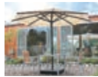
ステラ CP P65-66