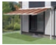
ECO 40 P39-40