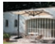
ロディ・グラファイト P83-84