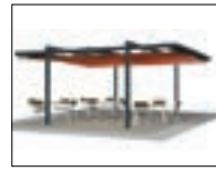
リバーロ グランデ P25