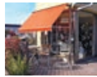
ボスコスウェーデン P41-42