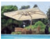
カプリ・レーニョ P75-76