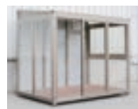
りらくハウス ND P97-100