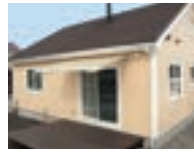
ECO 40 P53-56