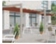
ゆらぎ 3 P31-32