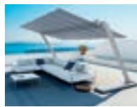
フレクシー ZEN P89