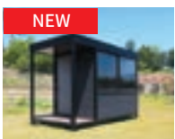
バリアブル Room P95-96