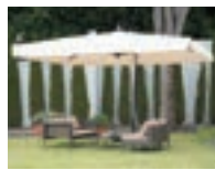
カプリ・グラファイト P77-78