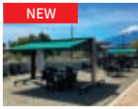
カシオペア Rタイプ P11-12