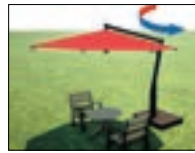
ステラサンフラワー P68