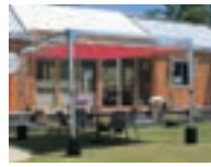
リバーロ Eタイプ P21-24