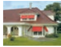
ボスコスウェーデン P57-60