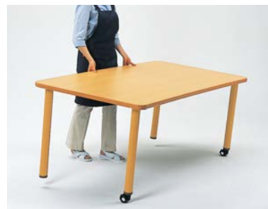
TTMCテーブルは全タイプ、片側キャスター付(ストッパー付)。1人でも楽にテーブル移動・レイアウト変更ができます。