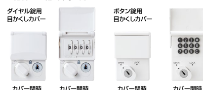
ダイヤル錠用目かくしカバー ボタン錠用目かくしカバー ダイヤル錠用目かくしカバー ボタン錠用目かくしカバー

ダイヤル錠とボタン錠には別途オプションで目かくしカバーをご用意しています。カバーを取り付けることで扉を開けた際にも他者から暗証番号を見られないようにすることができます。