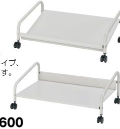
UDW-19L ¥18,600 16397 1段タイプ(ホワイト)