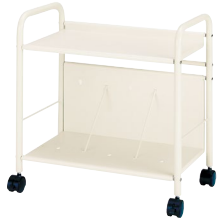
RFW-103 ¥23,100 16395 2段タイプ(ベージュ)

寸法/W550×D320×H580mm デバイダー2本(取付位置5ヵ所設定可能)付