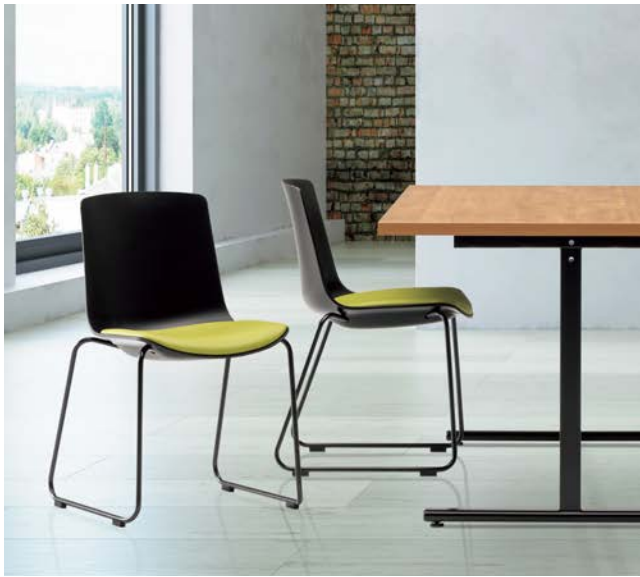
テーブル: TM1590URT >> P157