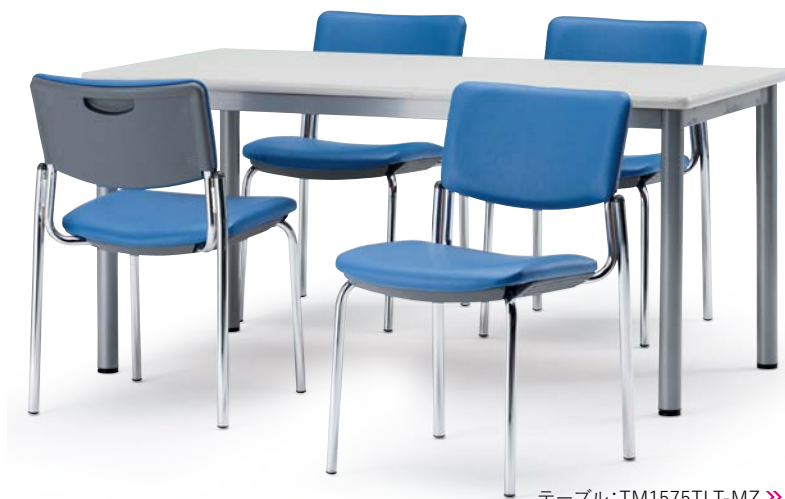
テーブル:TM1575TLT-MZ >> P154