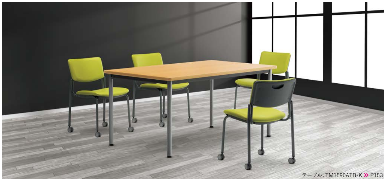
テーブル:TM1590ATB-K >> P153