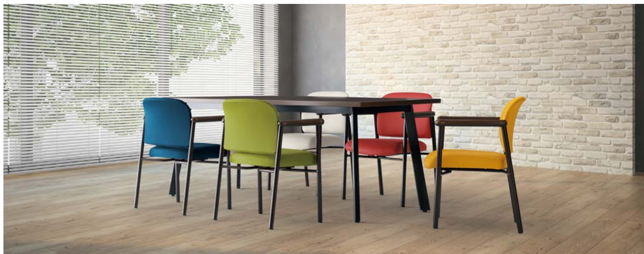
テーブル: TM1890UM-K ▶ P151

大きな背もたれと超厚張の座。安定感のあるφ 28.6mm フレームに 木目調肘が印象的な、椅子本来の機能性能を追求したパーソナルチェア