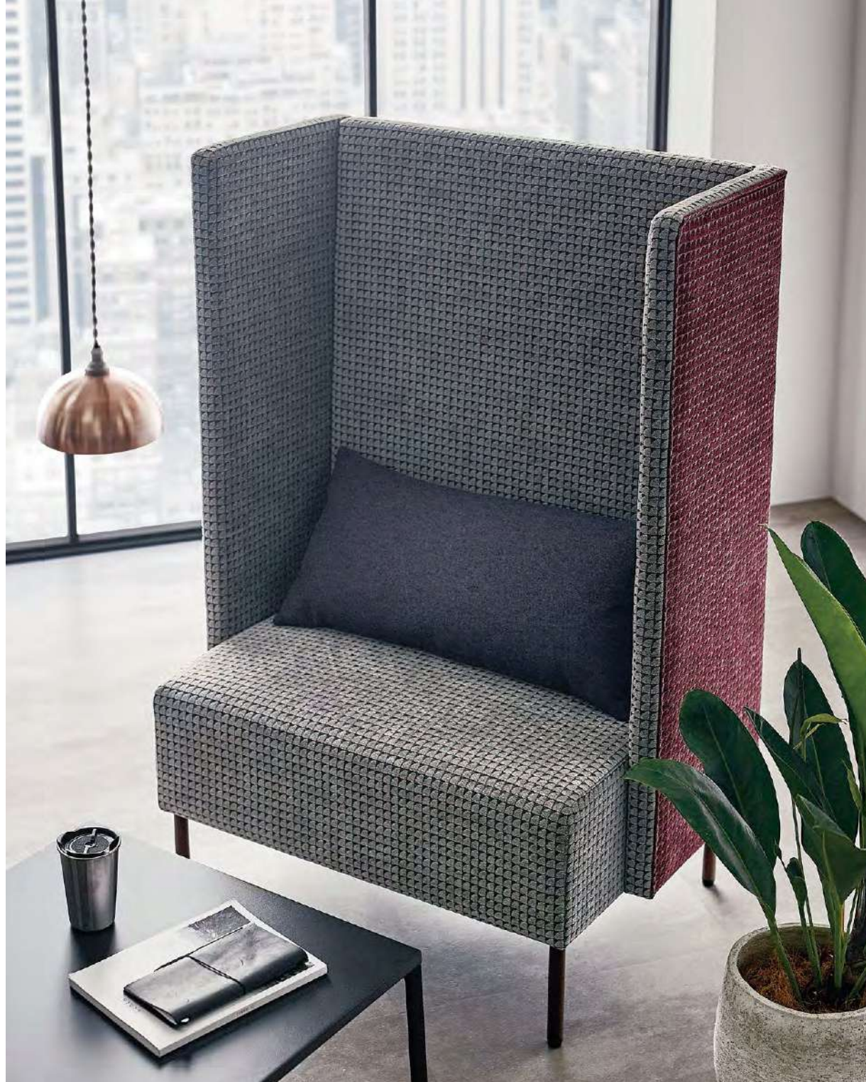
イス:UP6027・UP6030 クッション:UP5899(P.55)