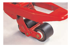
小さな溝と段差越えに ボギー (オプション) BM30タイプには標準 (但し、最低高さ80mmタイプのみ)