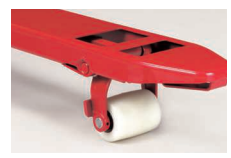
清潔感を求める方に 白ウレタン (オプション) ・BM15・25タイプのみ