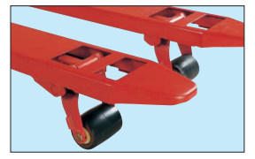
耐久性と静かさに優れたポリウレタン車輪を標準装備。