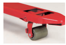
無色ウレタン ・BM15・25タイプのみ