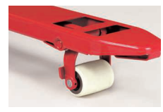
軽量化を求める方に ナイロン (オプション) BM15・25タイプ