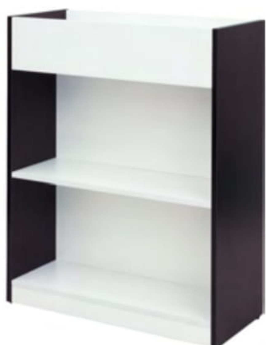
■ ダークN × □ ホワイトA