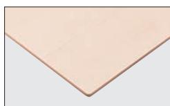
TP-193T TOP / TJY 2080K