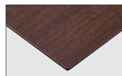
TP-193D TOP / TJ-301KQ98