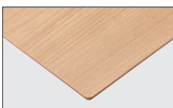
TP-193C TOP / JC-2016K