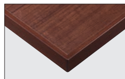
TP-192K TOP / TJ-2031KQ98