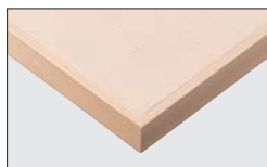
TP-192T TOP / TJY 2080K