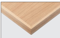
TP-192C TOP / JC-2016K