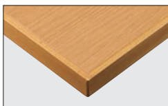
TP-192N TOP / AY-1021KG