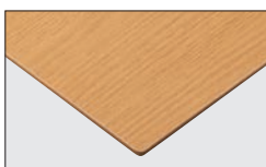
TP-193N TOP / AY-1021KG