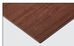
TP-193K TOP / TJ-2031KQ98